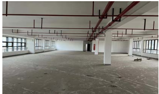
澄西路 144 号、146 号、通渡北路 281 号