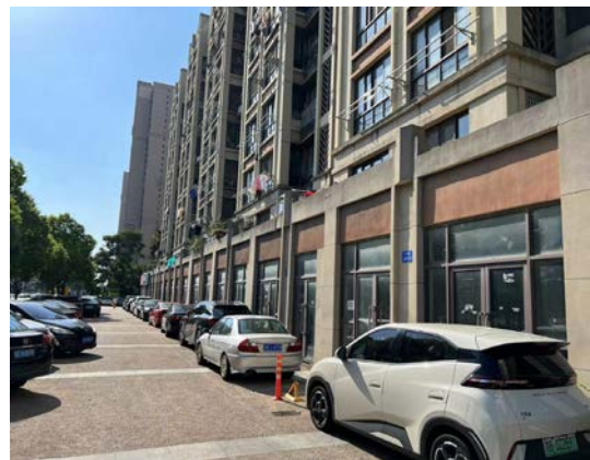
天庆路 280-294 号