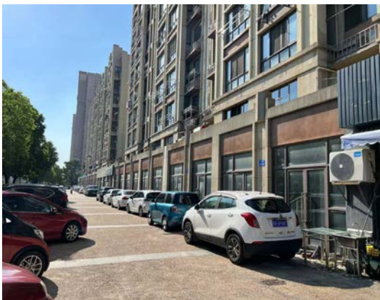
天庆路 262、264、268 号