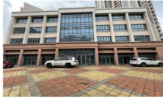
澄西路 144 号、146 号、通渡北路 281 号