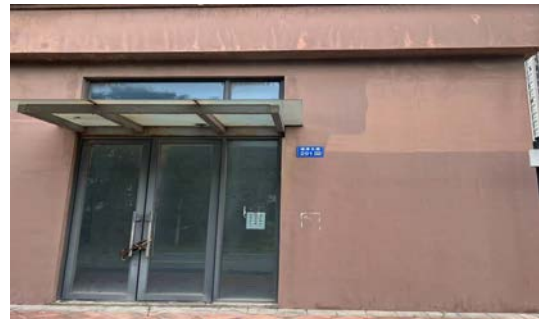
通渡北路 289 号、通渡北路 291 号