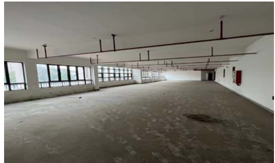
澄西路 144 号、146 号、通渡北路 281 号