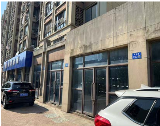
天庆路 232、236 号