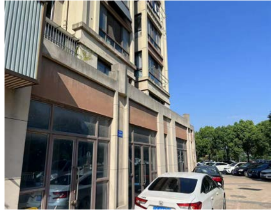
天庆路 224 号