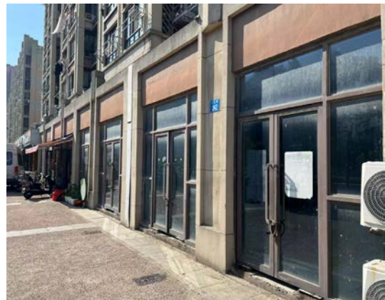
天庆路 242、244、248 号