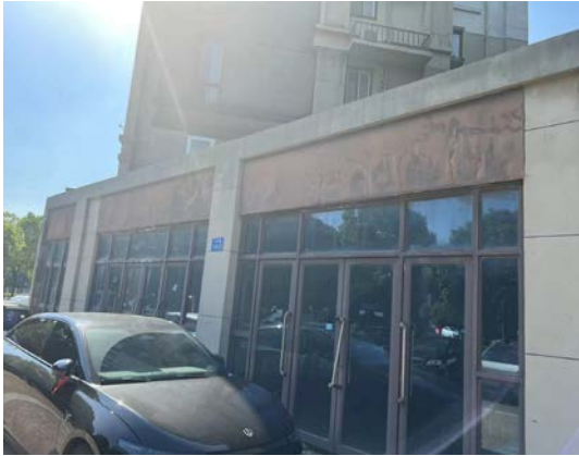
天庆路 220 号